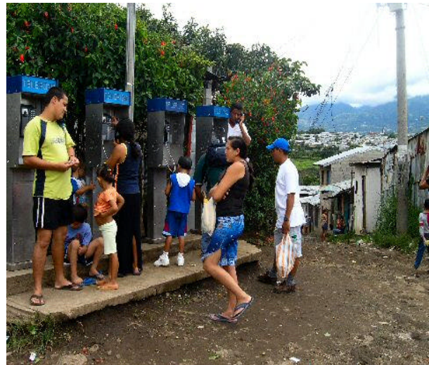
Stadtteil „La Carpio“ San José, Costa Rica – Heimwehanrufe? (dh)

das Weltcredo lügen strafen. Es kann es nicht jeder schaffen, im kapitalistischen System. Oft sind es gerade die Mutigen, die alles zurücklassen, ihr Leben riskieren, statt acht Stunden fünfzehn Stunden arbeiten ohne mit der Wimper zu zucken und uns mit hoffnungsvollen Augen anschauen, wissend, dass sie alles richtig gemacht haben und darum vom System belohnt werden müssen. Stattdessen: „Wenn du noch zwei Stunden mehr arbeitest, darfst du bleiben, zum gleichen Lohn“. Der Migrant führt uns das Scheitern des kapitalistischen Systems vor Augen – mit seiner puren Anwesenheit. Das ist wirklich kaum auszuhalten.