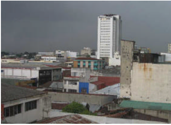
San José, Costa Rica – das El Dorado der Nicaraguaner (dh)