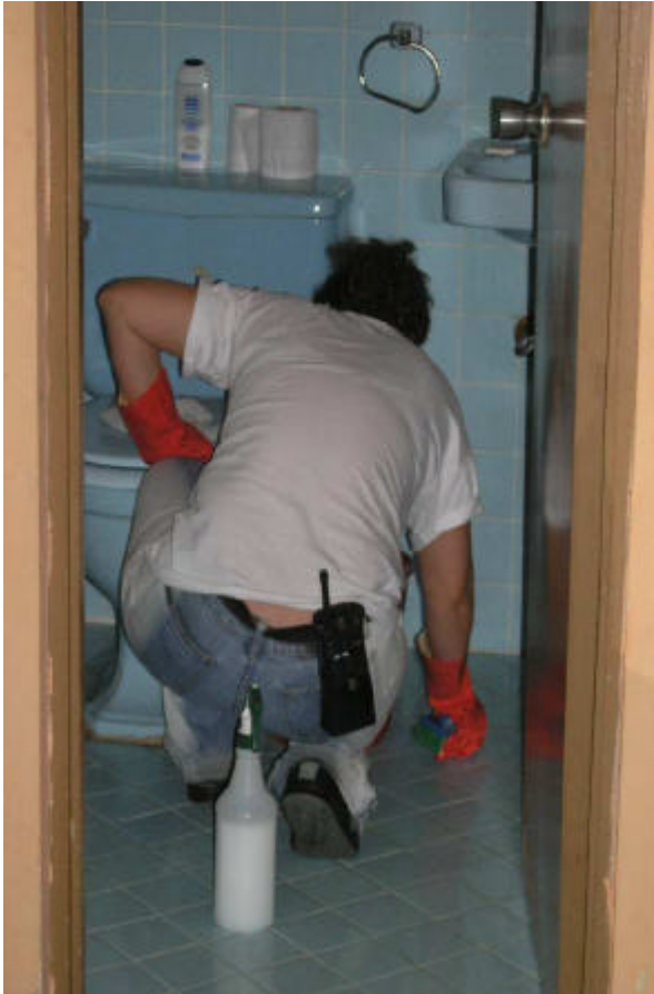
Nicaraguanische Hotelangestellte in San José, Costa Rica (dh)

Ihr Status: Illegal. Mit dem neuen Gesetz hat die Migrationsbehörde das Recht, Personen zu kontrollieren, wo sie will. Wer heute einem Migrant ohne Papiere Arbeit oder Unterkunft anbietet, wird bestraft. Von den Gegnern wird das Gesetz als Rückschritt bezeichnet. Der demokratische Staat verliere zu Gunsten des Polizeistaates an Terrain. Es berücksichtige auch nicht die Tatsache, dass ohne den nicaraguanischen Arbeiter, legal oder illegal, die landwirtschaftliche Produktion (Kaffee, Bananen, Ananas) zusammenbrechen würde. Eben so wenig, dass ohne nicaraguanische Hausangestellte, die costaricanischen Frauen, keiner Arbeit