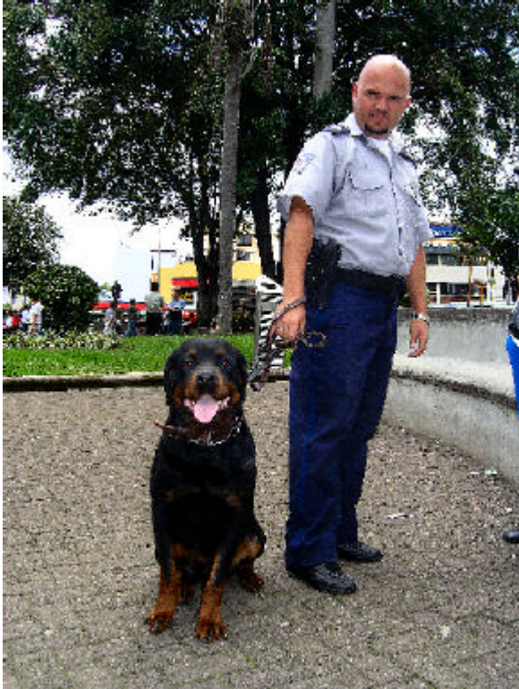
Migrationsbehörde mit tierischer Unterstützung (dh)

dunklen Säcken. Die Migrationsbehörde macht regelmässig ihre Tour durch den Park, Kameras seien ebenfalls installiert worden.