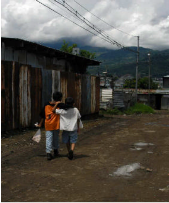
Stadtteil „La Carpio“ San José, Costa Rica (dh)

Ein Taxifahrer zeigt mit seinem Zeigfinger auf ein paar zerlumpte Gestalten am Strassenrand und meint, dies seien Nicas; „unsere Krankheit, unser Krebs“. Unisono ist zu vernehmen: Die Ticos mögen uns nicht. Wir nehmen ihnen die Arbeit weg, belasten das Schul- und Gesundheitswesen, klauen, rauben, entführen, vergewaltigen und ermorden. Wie in vielen Ländern, gibt es auch in Costa Rica genug Studien, die das Gegenteil beweisen. Die Migrantin produziert mehr, als sie konsumiert und zahlt mehr Steuern, als sie Leistungen in Anspruch nimmt. In der Regel ist der Migrant jung, gesund und macht die Arbeit, für die keine Arbeiter im eigenen Land gefunden werden. Doch trotzdem. In jedem Land stören die Armen und vor allem die armen Ausländer, weil sie oft noch ärmer sind. Sie stören und machen Angst, weil sie