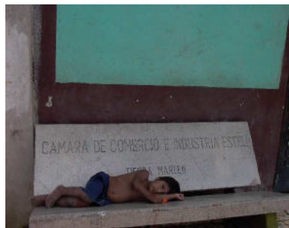
Aufschrift der Bank: Wirtschafts- und Handelskammer Estelí